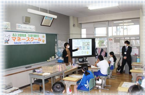
日本銀行よりクイズ、新しいお札と500円貨を紹介