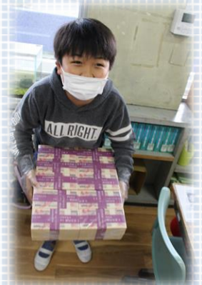
1億円は重たかった・・・