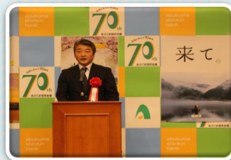
福島相双復興推進機構 新居専務理事 様