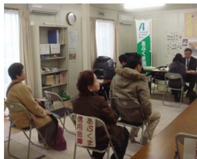
(写真は郡山市富田町における移動相談会の様子)