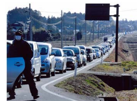
避難指示を受け避難する住民